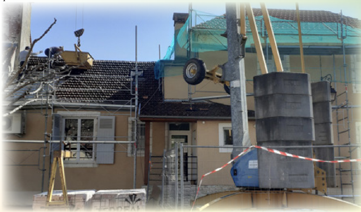
Les travaux de réfection de la toiture réalisés par l'entreprise Teixeira Paul viennent de s'achever.