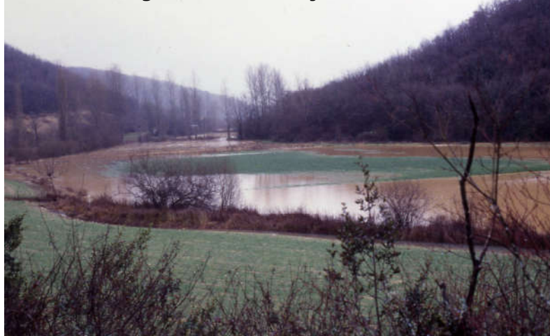
Vallée du Blagour - Crue du 10 janvier 1996

Ne téléphonez pas : libérez les lignes pour les secours