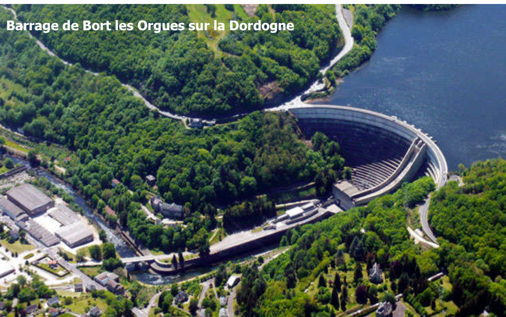
Barrage de Bort les Orgues sur la Dordogne

Ne prenez pas votre voiture ; ne forcez pas les interdictions